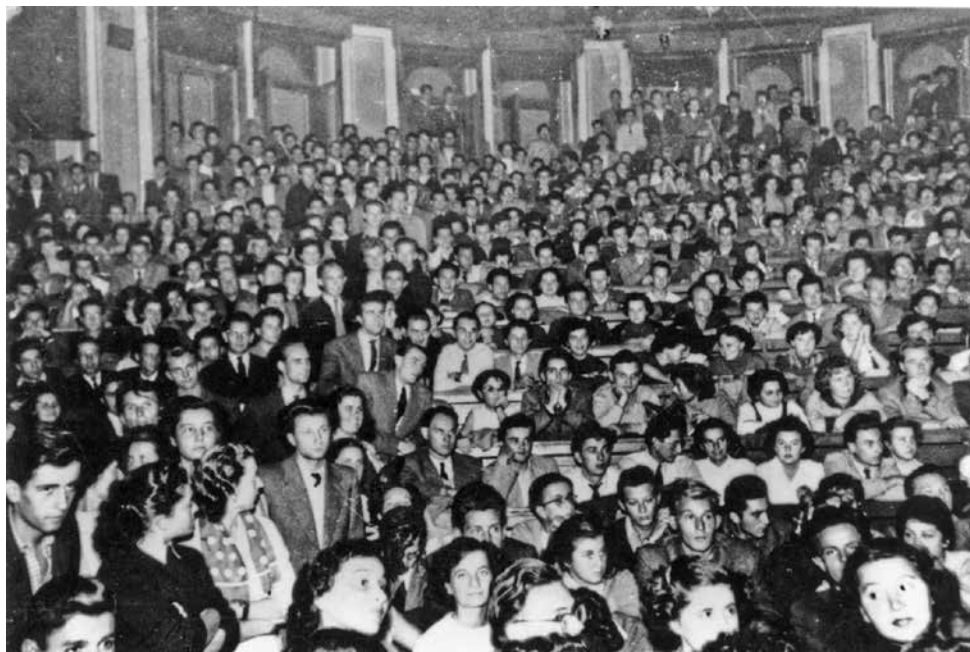
A MEFESZ gyűlése a szegedi egyetem bölcsészkarának Auditórium Maximumában, 1956. október 20.