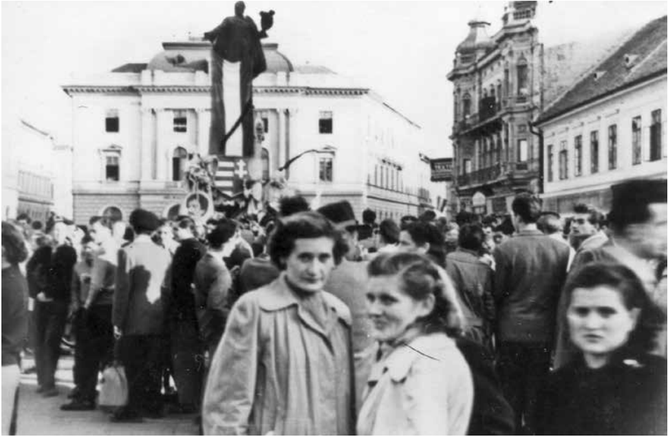
Tüntető a szegedi Klauzál téren 1956 októberében