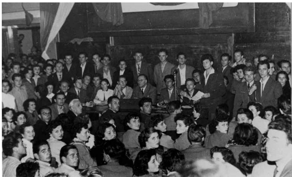
Az 1956. október 20-i MEFESZ-nagygyűlés elnöksége