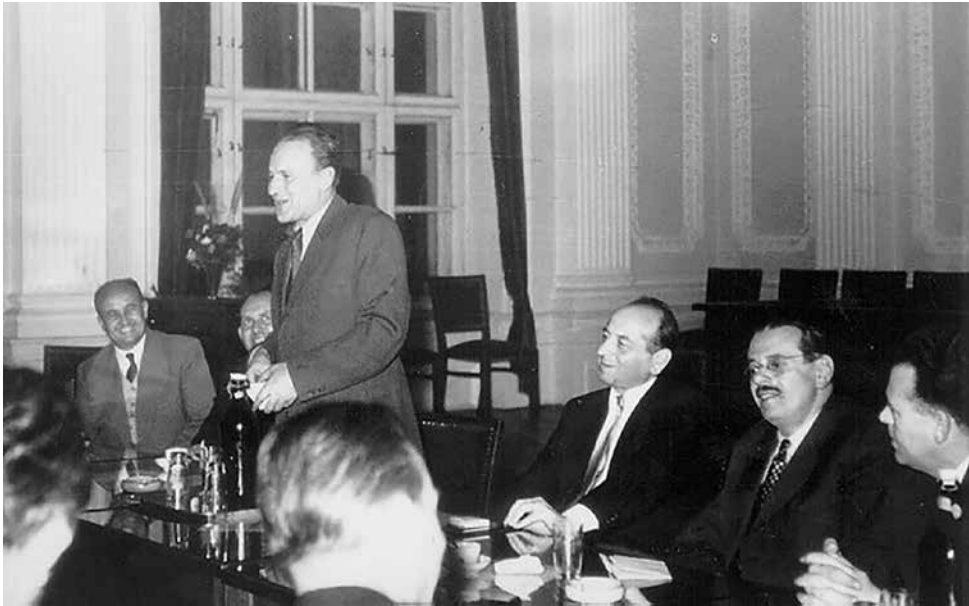
Kádár János a szegedi egyetemen 1961-ben